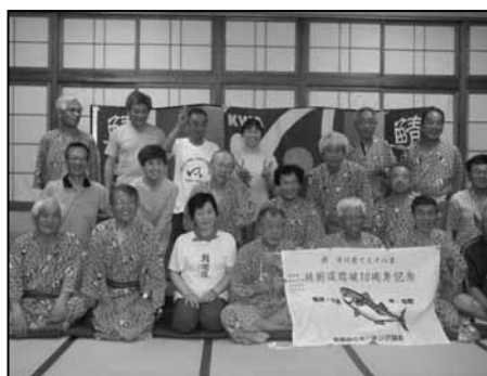
針畑越コース隊の戦士