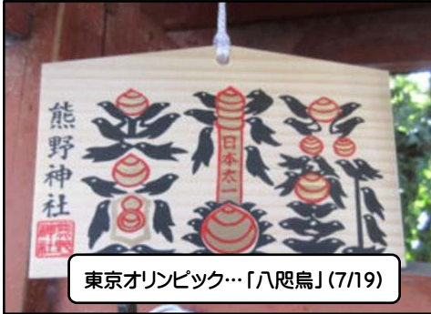
東京オリンピック…「八咫鳥」(7/19)