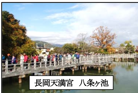
長岡天満宮 八条ヶ池

ロードに入り嵐山公園手前でゴールしました。久しぶりの健脚ウォーク、一杯の歩きを満喫しました。