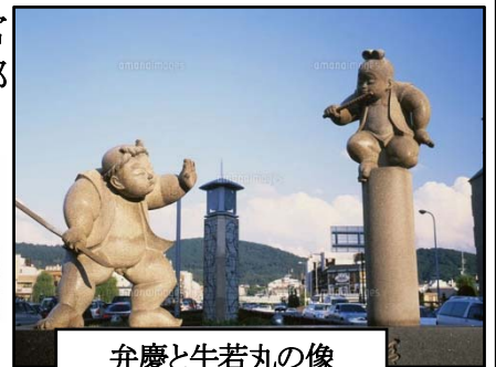
弁慶と牛若丸の像