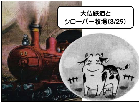
大仏鉄道とクローバー牧場(3/29)