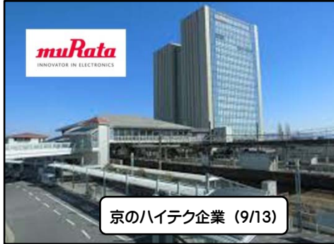
京のハイテク企業 (9/13)