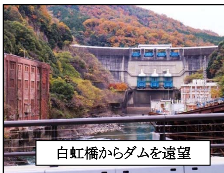
白虹橋からダムを遠望

カードと、歴まちカードを頂いて解散しました。テーマであったダムカードは残念ながらゲットできませんでした。