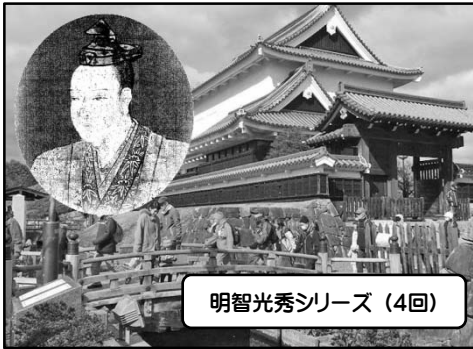
明智光秀シリーズ (4回)