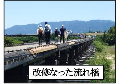
改修なった流れ橋

季彩館で弁当を食べて休憩後、流れ橋を渡り返し、田園風景の中、東に進み近鉄大久保駅にゴールしました