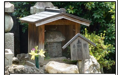
東向観音寺の土蜘蛛