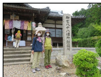
八十八ヶ所完歩記念