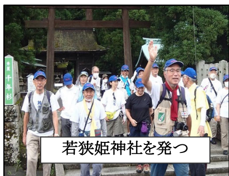
若狭姫神社を発つ

最近ではスタートして初日の前半(熊川宿迄)はウオークしましたが、以降は後方支援に回っておりました。今回は、事前に会長から先頭歩行を委ねられ、概ね全体の2/3(約60km)ウオークでき、我ながら驚いております。今回もコース上の集合&スナップ写真撮影、大津市梅ノ木の旅館「石楠花山荘」中庭での集合撮影もでき良かったです。次回以降も、気持ちを新たに、健康に留意し、さば街道戦士と再会出来ることを楽しみにしております。