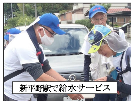
新平野駅で給水サービス