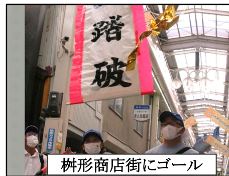
榊形商店街にゴール