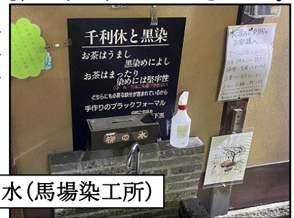
柳の水(馬場染工所)