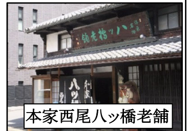
本家西尾八ッ橋老舗