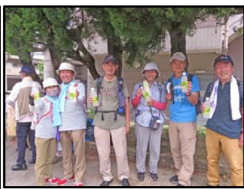
給水ポイントにて