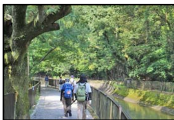
琵琶湖疏水道に行く

***お願い*** 初めて参加される方は、「参加申込票」への記入と提出をお願いします。 「参加申込票」は、当日会場で入手頂くか、事前にホームページからダウンロード頂けます。