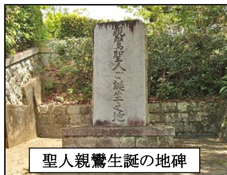
聖人親鸞生誕の地碑