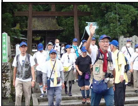
若狭姫神社を発つ