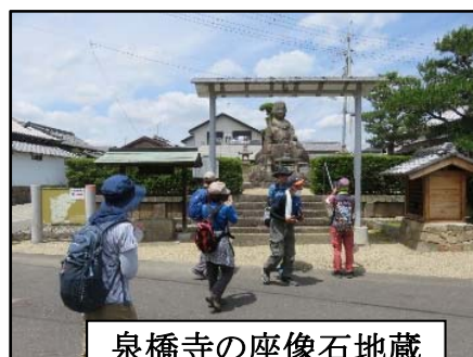
泉橋寺の座像石地藏

途中、城陽市商工観光課主催の「山背古道・春のは一ふウオーク」に参加の多くのウォーカーとすれ違い、知己の仲間もおられ、歩く楽しさを再認識しました。