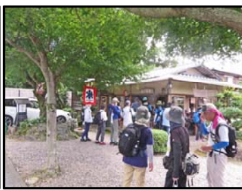
お馴染みの池の茶屋