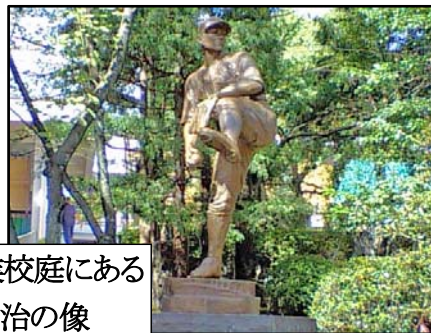
旧京都商業校庭にある 澤村栄治の像