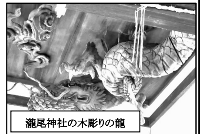
瀧尾神社の木彫りの龍