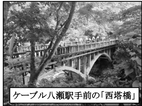
ケーブル八瀬駅手前の「西塔橋」