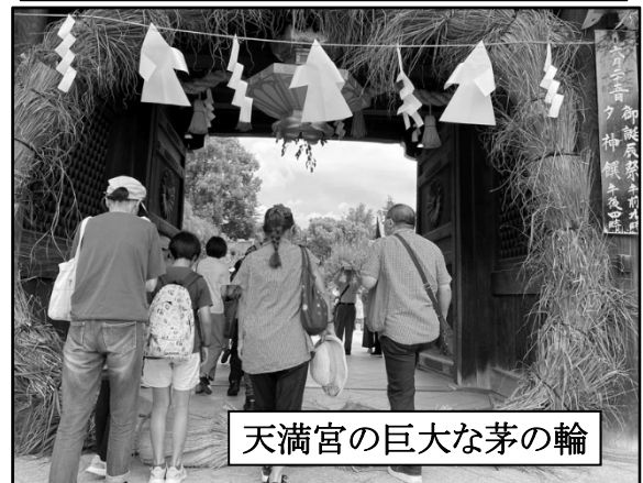
天満宮の巨大な茅の輪