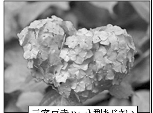
三室戸寺ハート型あじさい