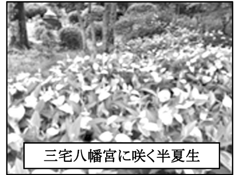
三宅八幡宮に咲く半夏生