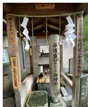
清盛ゆかりの御神水