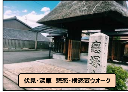
伏見・深草 悲恋・横恋慕ウオーク