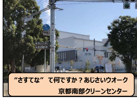
“さすてな”て何ですか?あじさいウオーク 京都南部クリーンセンター