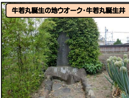
牛若丸誕生の地ウオーク・牛若丸誕生井