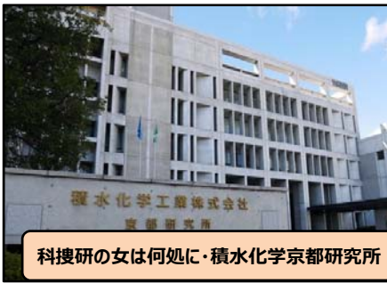
科科研の女は何処に・積水化学京都研究所