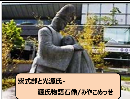
紫式部と光源氏・ 源氏物語石像/みやこめっせ