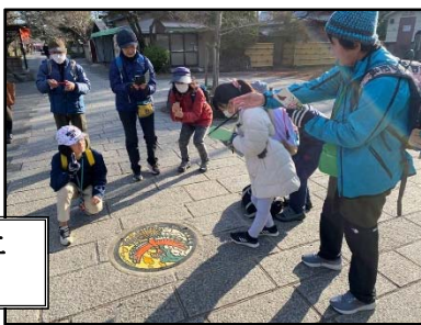
嵐山ポケふた (ホウオウ)