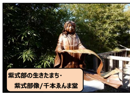
紫式部の生きたまち・ 紫式部像/千本ゑんま堂