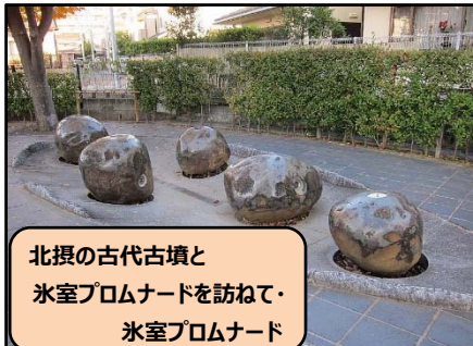
北摂の古代古墳と 氷室プロムナードを訪ねて・ 氷室プロムナード