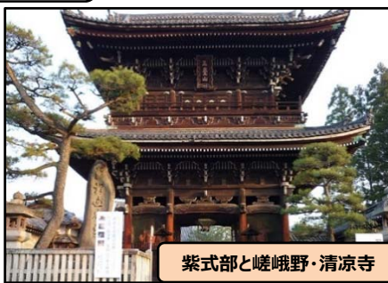
紫式部と嵯峨野・清凉寺