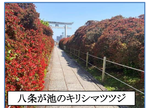
八条が池のキリシマツツジ