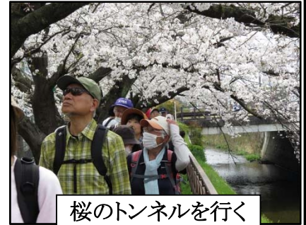
桜のトンネルを行く