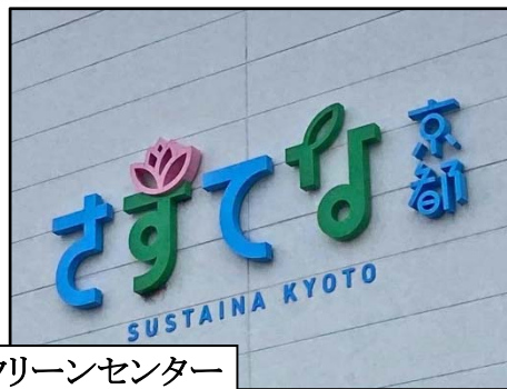
京都南部クリーンセンター