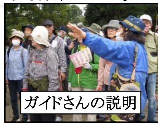
ガイドさんの説明

桜林では、様々な種類の桜が見られ、特に「ソメイヨシノ」種の特異な植生歴史には、日本人としての誇りも感じました。